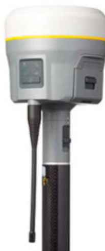
Рисунок 1: Приемник Trimble R10, оснащенный технологией Trimble 360

Для того, чтобы геодезические компании могли воспользоваться всеми преимуществами новейших GNSS технологий и получать отдачу от своих вложений, в приемнике Trimble R10 была реализована технология Trimble 360, которая позволяет принимать сигналы всех существующих и планируемых GNSS систем, включая GPS, ГЛОНАСС, Galileo, Compass и QZSS, а также существующих и запланированных дифференциальных систем дополнения включая WAAS, EGNOS, MSAS и GAGAN. Благодаря 440 каналам GNSS приемника R10, технология Trimble 360 обеспечивает непрерывный и надежный прием всех доступных сигналов GNSS.