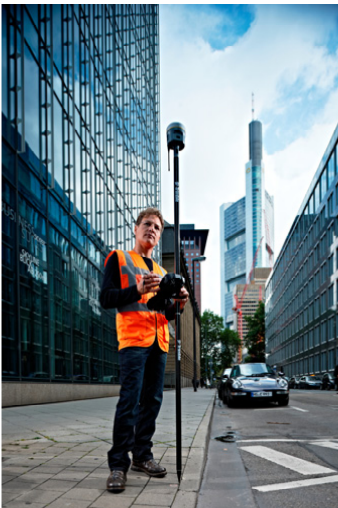
Рисунок 3: Приемник Trimble R10 с технологией Trimble 360 в городских условиях